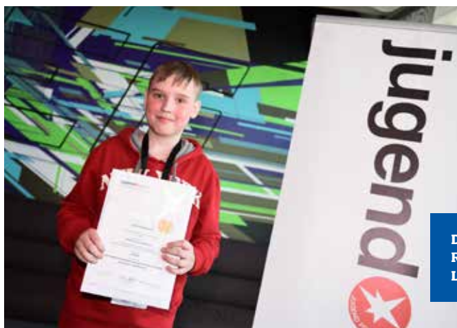
Die Nachwuchsforscher wurden im Rahmen der Verleihfeier für ihre Leistungen geehrt.