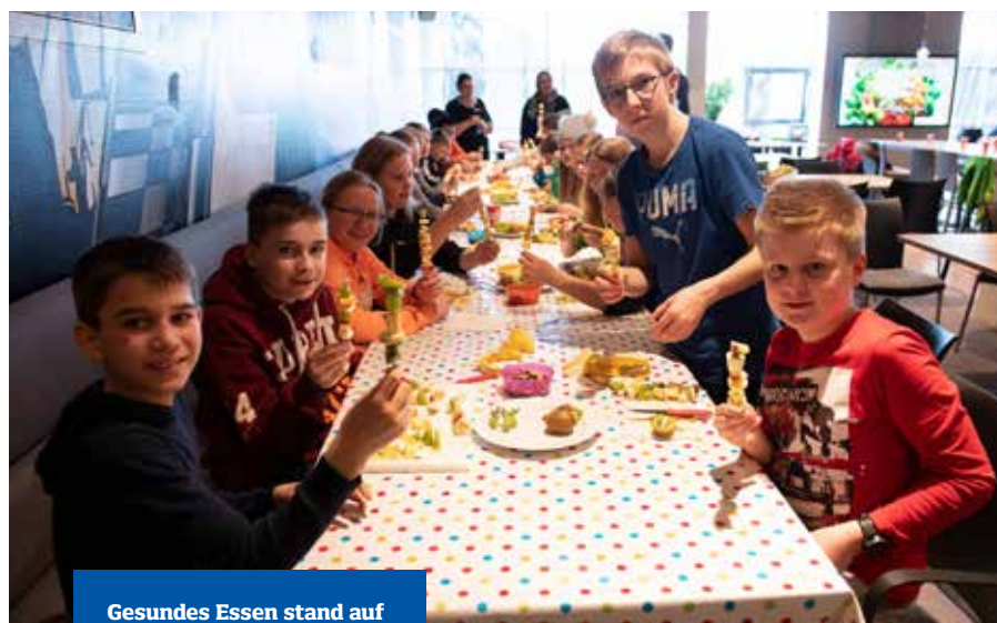
Gesundes Essen stand auf dem Stundenplan.

In einem spielerischen Gruppenpuzzle wurden die Antworten selbst erarbeitet und erläutert. Die allgemeine Erkenntnis der Kids war nach der ersten Einheit schnell klar: Eine ausgewogene und nährstoffreiche Ernährung kann sowohl einfach als auch lecker sein und dennoch ernähren sich viele oftmals falsch. Dem sollte aktiv entgegengewirkt werden. Nach einer kurzen Stadionführung, frischer Luft sowie einigen Bewegungsspielen, um sich auch körperlich aktiv zu betätigen, wurden die Nachwuchsköche selbst an den Küchen-