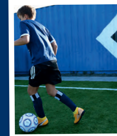
6. ... vollendet die Drehung und verschärft das Tempo – geschafft!