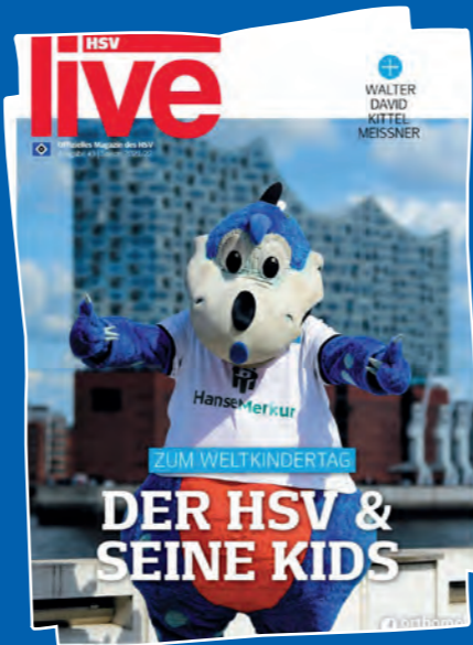
Speziell für euch Kids ist auch eine Spezial-Ausgabe der großen HSVlive erschienen. Habt ihr schon durchgeblättert? ☺