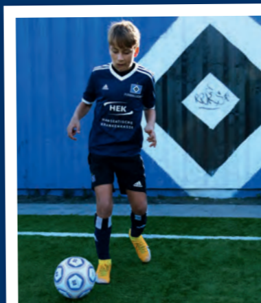
1. Dribbelt auf euren Gegenspieler zu, haltet den Ball dabei eng am Fuß und geht leicht in die Knie.