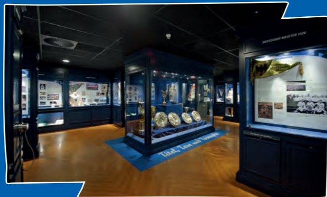
Alle HSV-Kids hatten in der Aktionswoche freien Eintritt ins HSV-Museum. Anschließend konnten sie noch im HSV-Shop vorbeischaun – da gab es nämlich den Print des Lieblingsspielers beim Kauf eines Trikots gratis dazu.