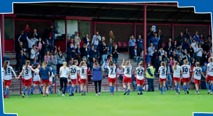
Einige Kids jubelten den HSV-Frauen bei ihrem Pokalerfolg gegen den FSV Gütersloh live im Stadion zu.