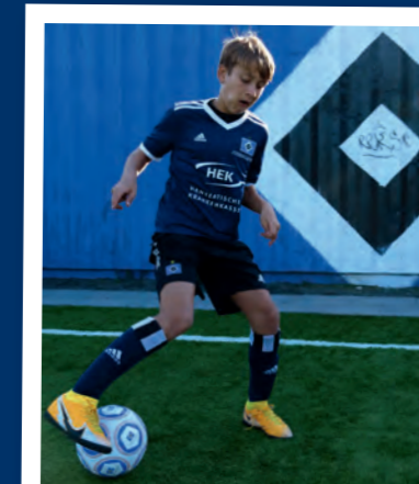
3. ... und um den Ball herum.