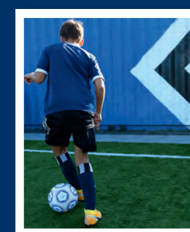
5. Nehmt jetzt die Außenseite des anderen Fußes, um den Ball wieder in die Spielrichtung zu führen ...