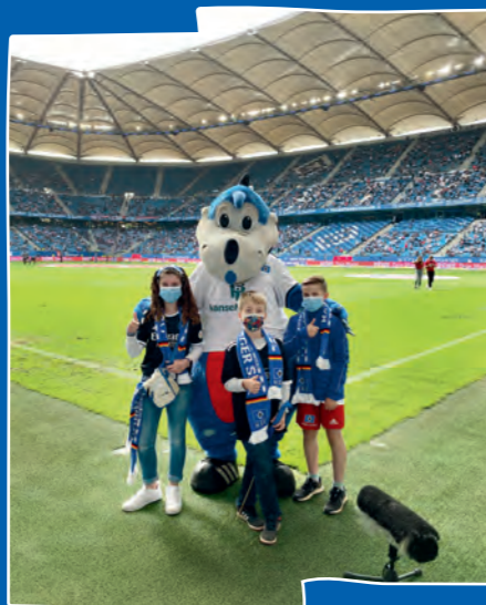
Beim Jungs & Deerns Spieltag gegen den 1. FC Nürnberg gab es ein exklusives Meet & Greet mit dem Dino zu gewinnen. Ein tolles Erlebnis!