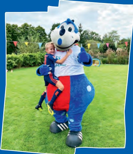
Auch das HSV-Maskottchen Dino Hermann war bei der Aktionswoche natürlich mit dabei und hat einige HSV-Kids zu Hause überrascht. Die Freude war riesig!

Wir hoffen, die Woche hat euch genauso viel Spaß gemacht wie uns. Wir freuen uns schon auf die nächsten gemeinsamen Aktionen mit euch!