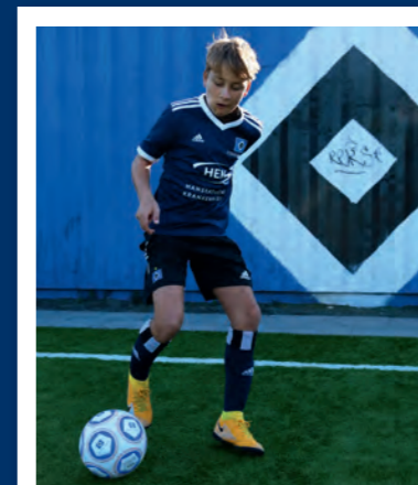
2. Führt die Innenseite eures Dribbelfußes jetzt am Ball entlang...